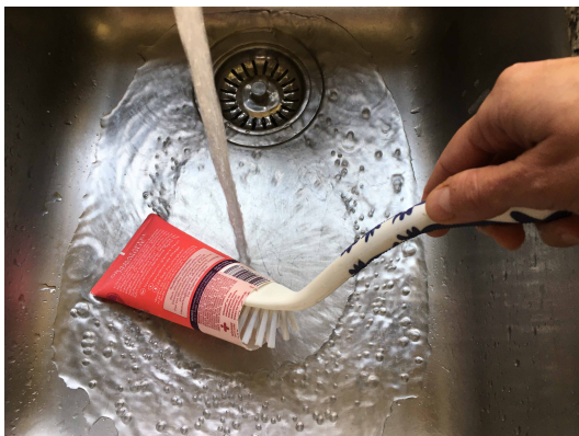
3. Wasch die Tube gut aus, damit sie sauber ist.