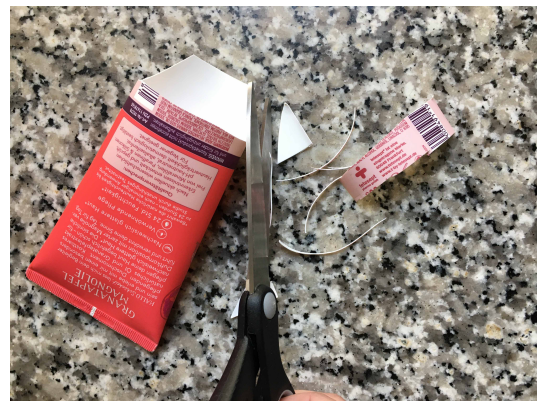
4. Auf der Hinterseite schneidest du die Tube gerade ab. Auf der Vorderseite schneidest du eine längere Lasche mit abgeschrägten Ecken, so dass du sie etwa 1,5 cm über den hinteren Teil klappen kannst.