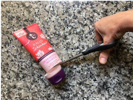
2. Mit der Schere schneidest du den Deckel ab.