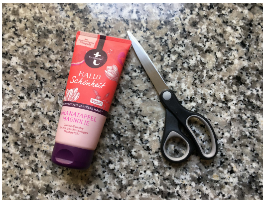
1. Eine leere Duschgeltube und Schere bereitlegen.