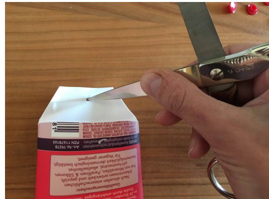
5. Mit einer Schere oder Ahle bohrst du Löcher: eines in der Mitte der Lasche und eines auf der Hinterseite. Pass auf, dass du nicht abrutschst und dich schneidest!